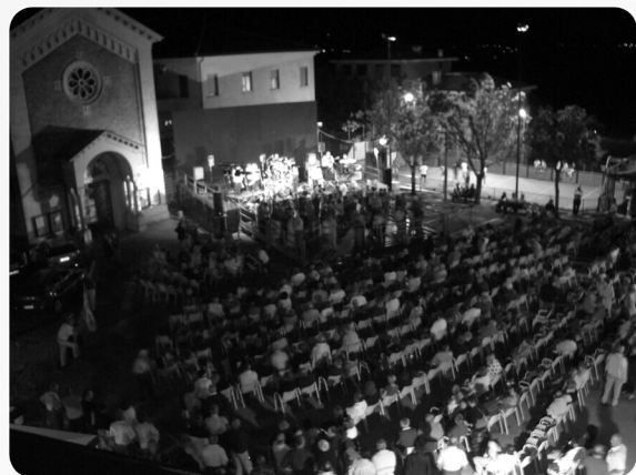
La Festa del Castello