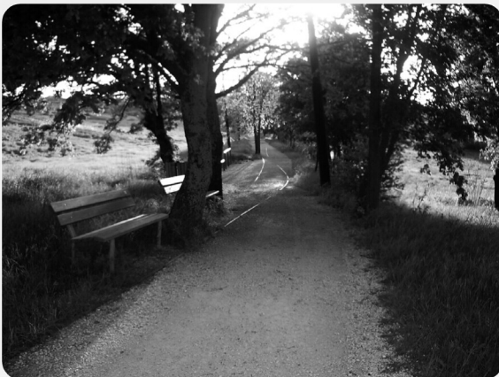
↳ Percorso ferroviario

L'arboreto didattico è uno scorcio di paradiso, del nostro Castello non abbastanza valorizzato; quindi intendiamo valorizzare questo angolo di verde con momenti culturali e ricreativi.