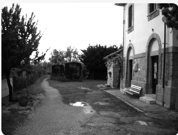
L'antica Stazione Ferroviaria

Proseguire il marciapiede che dalla rotonda di Fiorina arrivi fino alla Chiesa.