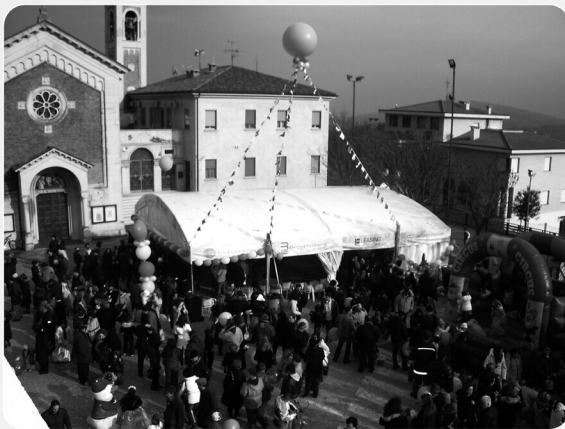
Il Carnevale in Piazza

DOMAGNANO E LA SUA GENTE INSIEME A VOI PER UN CASTELLO MIGLIORE