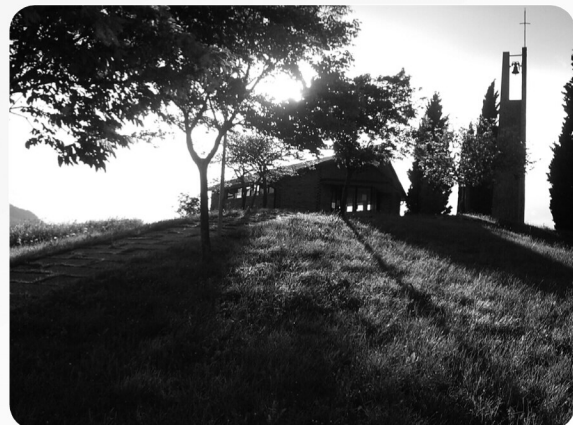
Il Parco della Torraccia ↳