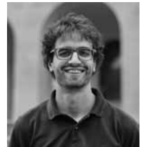
5. Teodoro Forcellini