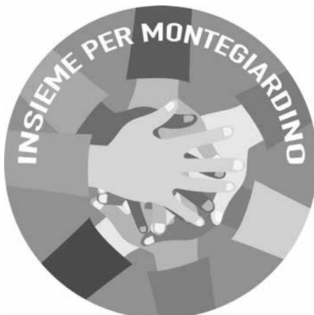
Lista "INSIEME PER MONTEGIARDINO"