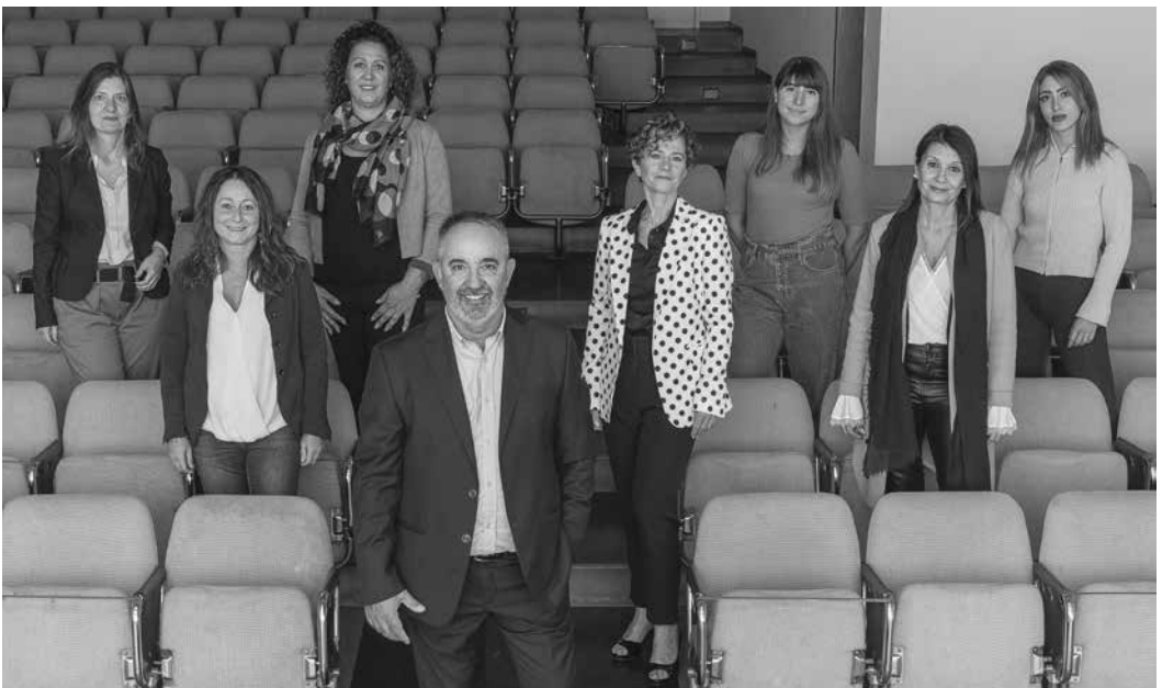
Lista "FIORENTINO VIVA"