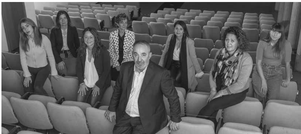
Lista "FIORENTINO VIVA"

Aiutaci a ridare valore e qualità alla "nostra" Fiorentino, a riportare inoltre quella socialità, quell'aggregazione che può ridisegnare una nuova Fiorentino Viva, SOSTIENICI, VOTA: FIORENTINO VIVA.